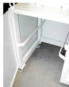
Maschinengestell für 120 l Container