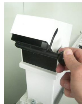
Sondertrichter zur manuellen Aufgabe der Festplatten